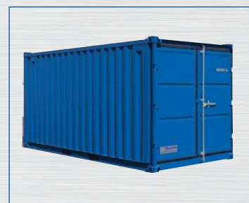
Typ LC 15'