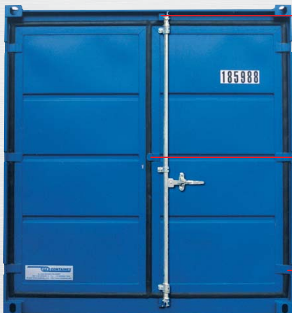
Kontener magazynowy z pakietem bezpieczeństwa