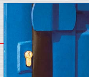
Wewnątrz usytuowany zamek bezpieczeństwa