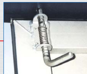
2 wewnątrz położone ocynkowane rygle