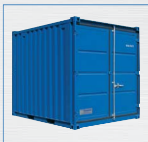
Typ LC 10'