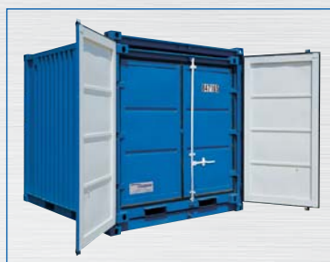
Przykład zestawu kontenerów magazynowych (LC 10' + 8')