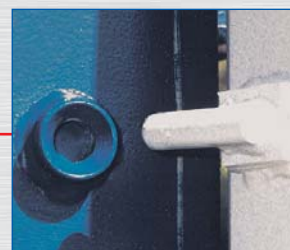
4 położone wewnątrz zabezpieczenia przeciw wyciągnięciu drzwi