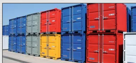
Paleta kolorów CTX-RAL