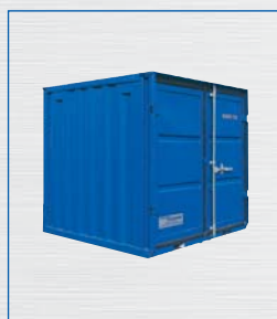
Typ LC 6'