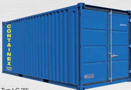
Typ LC 20'

Kontenery magazynowe CTX z pakietem bezpieczeństwa są dostępne w różnych rozmiarach i z różnym wyposażeniem.