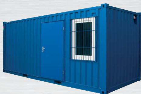
Typ LC 20'

CTX-kontener magazynowy z oknem i drzwiami są dostępne w dwóch wielkościach i wielu wariantach wyposażenia.