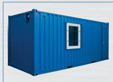
Typ LC 20'