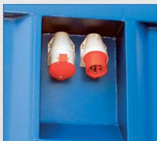
zagłębione wtyczki CEE