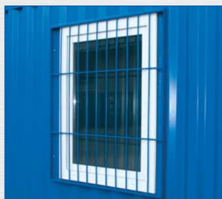
okna z kratami