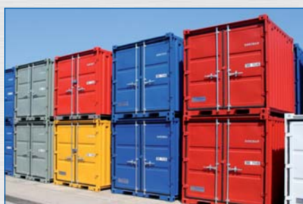
paleta kolorów CTX-RAL