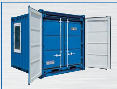
Przykład zestawu kontenerów magazynowych (LC 10' + 8')