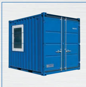
Typ LC 10'