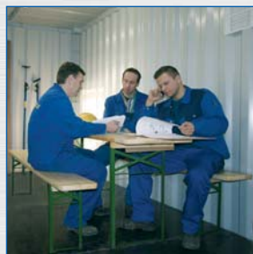
Pomieszczenie socjalne na budowie